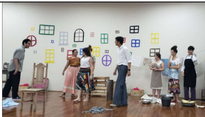
O Cortiço (Adaptação da obra de Aluísio Azevedo) 2º Informática 2022