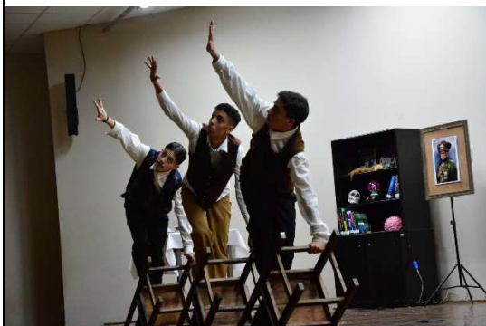
Noite na Taverna – Álvares de Azevedo 2º Meca (2023)