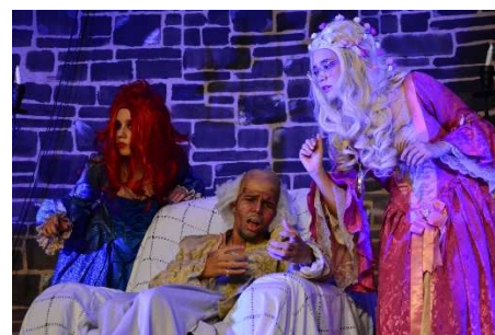
A Maldição do Vale Negro (texto: Caio Fernando Abreu) 1º Meca e 1º Edi (2023)