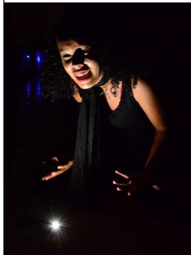
O Começo do Fim 2º Informática (2023)