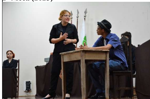
O Julgamento de Capitu (Adaptação original – Baseada na obra de Machado de Assis)