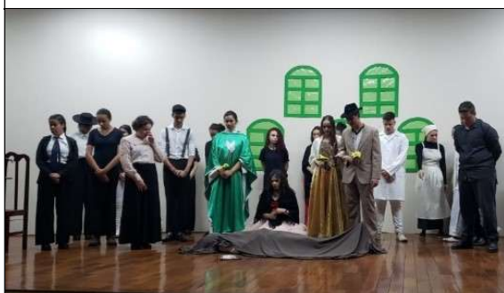
O Alienista (Baseado no conto de Machado de Assis) 2º Edificações 2022