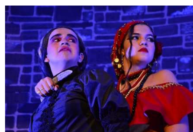
Navios Negreiros (texto original) 1º Meca e 1º Edi (2023)