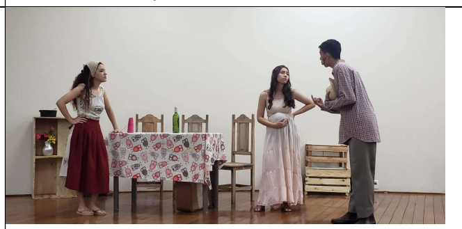
Pai Contra Mãe (Baseado no conto homônimo de Machado de Assis) 2º Mecatrônica 2022