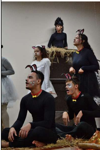
A Revolução dos Bichos (adaptação do texto de George Orwell) 2º Edificações (2023)