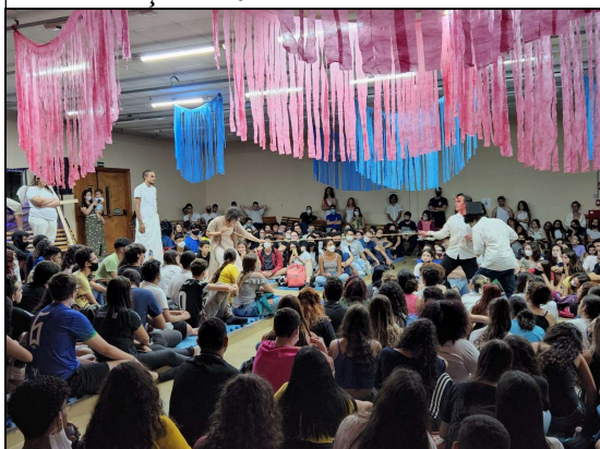
O Auto da Barca do Inferno (Adaptação da obra de Gil Vicente) 1º Mecatrônica 2022