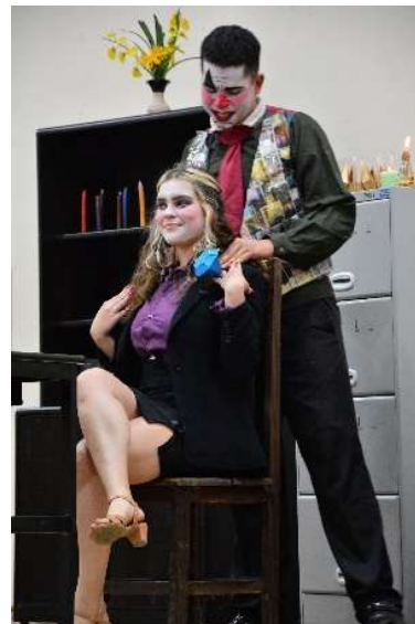
O Rei da Vela – Oswald de Andrade 3º Edi (2023)