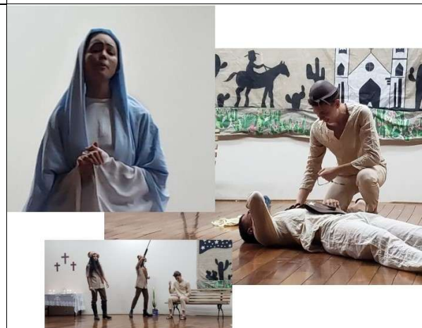
O Auto da Compadecida (de Ariano Suassuna) 3º Informática 2022