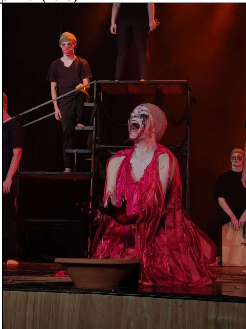
O Fim da Matéria (encenação de poemas de Augusto dos Anjos) 3º Mecatrônica