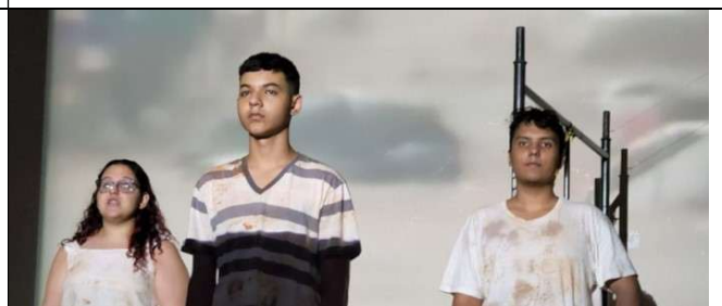
A Invasão (de Dias Gomes) 1º Informática 2022