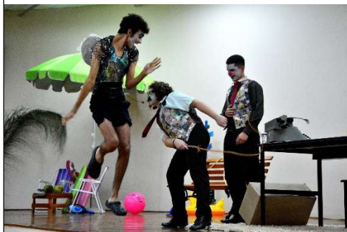
O Rei da Vela – Oswald de Andrade 3º Edi (2023)