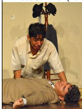
O rico avarento (Texto: Ariano Suassuna) 1º Informática - 2023