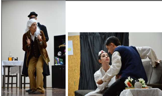
Os Físicos – Friedrich Dürrenmatt 3º Mecatrônica (2023)