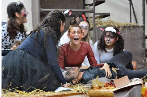
A Revolução dos Bichos (adaptação do texto de George Orwell) 2º Edificações (2023)