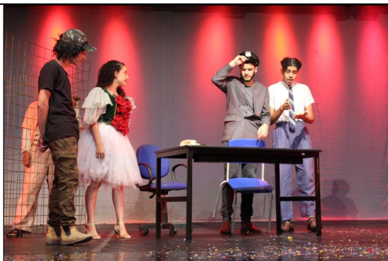
Lisbela e o Prisioneiro (de Osman Lins) 3º Edificações 2022